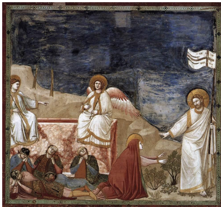
Giotto di Bondone (1265 ca. - 1337), Resurrezione e Noli me tangere , affresco, Cappella degli Scrovegni, Padova